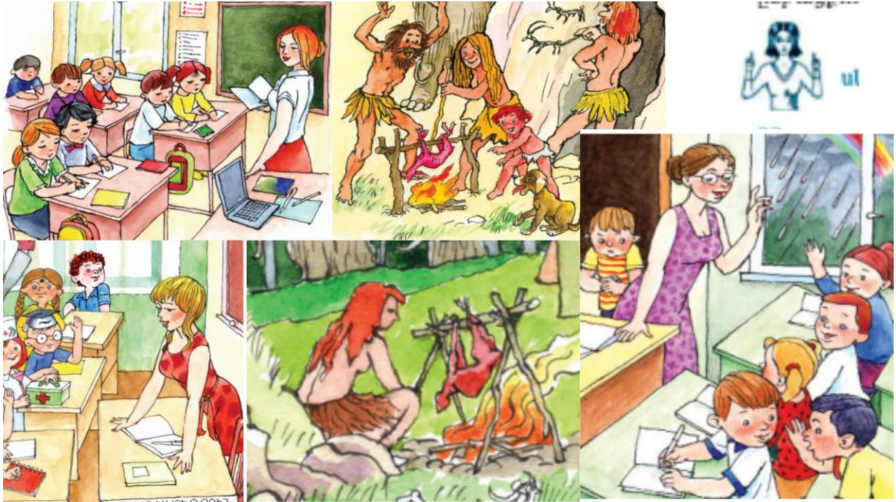
Պատկեր 2. Կնոջ կերպարը «Մայրենի» և «Հայոց լեզու» դասագրքերում

Նույն իրավիճակն է յոթերորդ դասարանի «Հայոց լեզու» դասագրքում, որտեղ ուսուցիչը միայն կնոջ կերպարով է ներկայացված: Այս ուսուցչուհու պատկերը կրկնվում է յուրաքանչյուր քերականական բաժնի անկյունում: Յոթերորդ դասարանի «Հայոց լեզու» առարկայում ևս ուսուցիչը ներկայացված է միայն կնոջ դերում: Նման իրավիճակ է նաև «Մայրենի 2» դասագրքում, որտեղ առաջին իսկ էջում ուսուցչուհին կրկին կին է (տե՛ս Պատկեր 1): Նման պատկերները սահմանափակում են թե՛ աղջիկների, թե՛ տղաների երազանքները՝ ցույց տալով, որ մասնագիտությունները սահմանափակված են կենսաբանական սեռով: